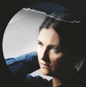
VENREDI 8 AVRIL SIMONE VEIL LES COMBATS D'UNE EFFRONTÉE (THÉÂTRE)