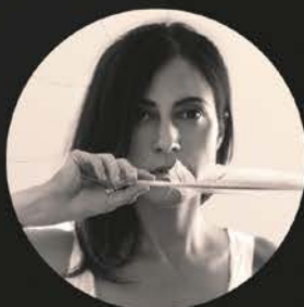
MARDI 29 MARS KEREN ANN (CONCERT)