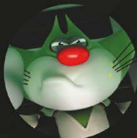
VENREDI 4 MARS OGGY ET LES CAFARDS (CINÉ CONCERT)