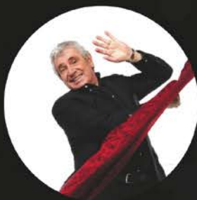
LUNDI 7 FÉVRIER MICHEL BOUJENAH (HUMOUR)