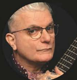
SAMEDI 30 AVRIL SANSEVERINO (CONCERT/CHANSON)

ET AUSSI... 3 nouvelles «Blind Sessions» (Led Zeppelin, Daft Punk et David Bowie) et 3 nouveaux bals populaires «Ô bal(s) masqués»