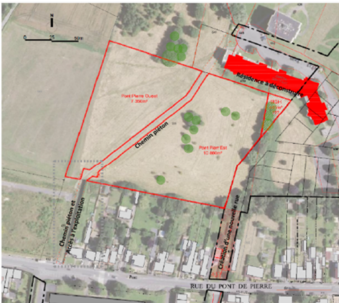
Localisation de la parcelle AK 0155 du quartier Pont-de-Pierre, traversée par un chemin piéton + chemin d'accès sur la parcelle AK 0432

En option, des terrains complémentaires pourraient être mis à disposition, dans le cadre de l'appel à projet concomitant du quartier de Sous le bois concernant la mise en place d'un projet agricole en permaculture et AB.