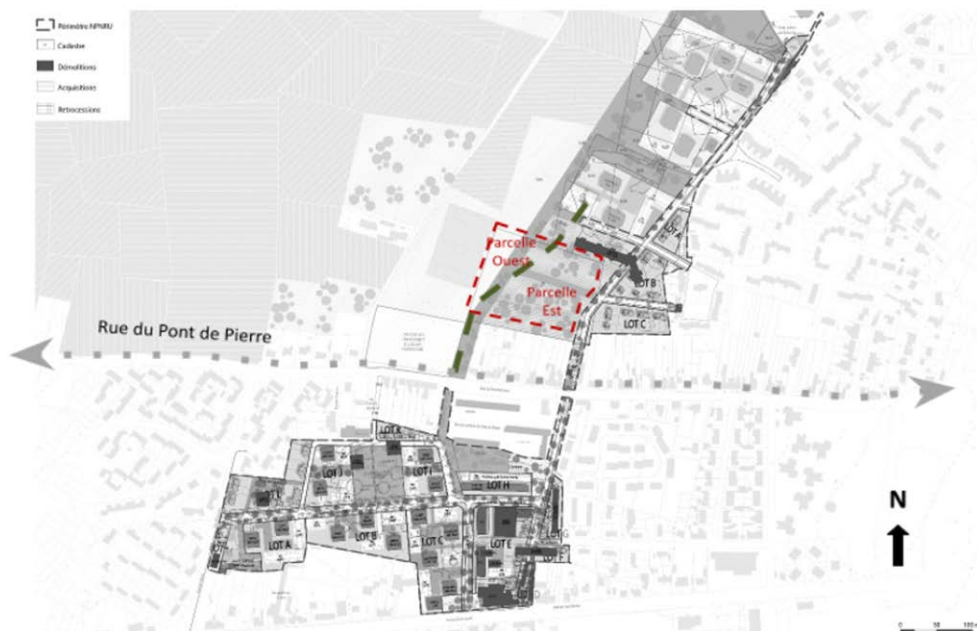
Localisation du projet agricole au sein du Nouveau Projet de Renouvellement Urbain (NPRU) de Pont de Pierre (quartier des Ecrivains au Nord et des Présidents au Sud)