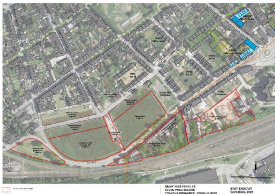
Localisation des différentes emprises et du site de la « Micro-ferme »

En option, des terrains complémentaires pourraient être mis à disposition par la collectivité ou par le bailleur social PROMOCIL selon des modalités à définir pendant le déroulé du présent appel à projet (convention d'occupation sur les réserves foncières)