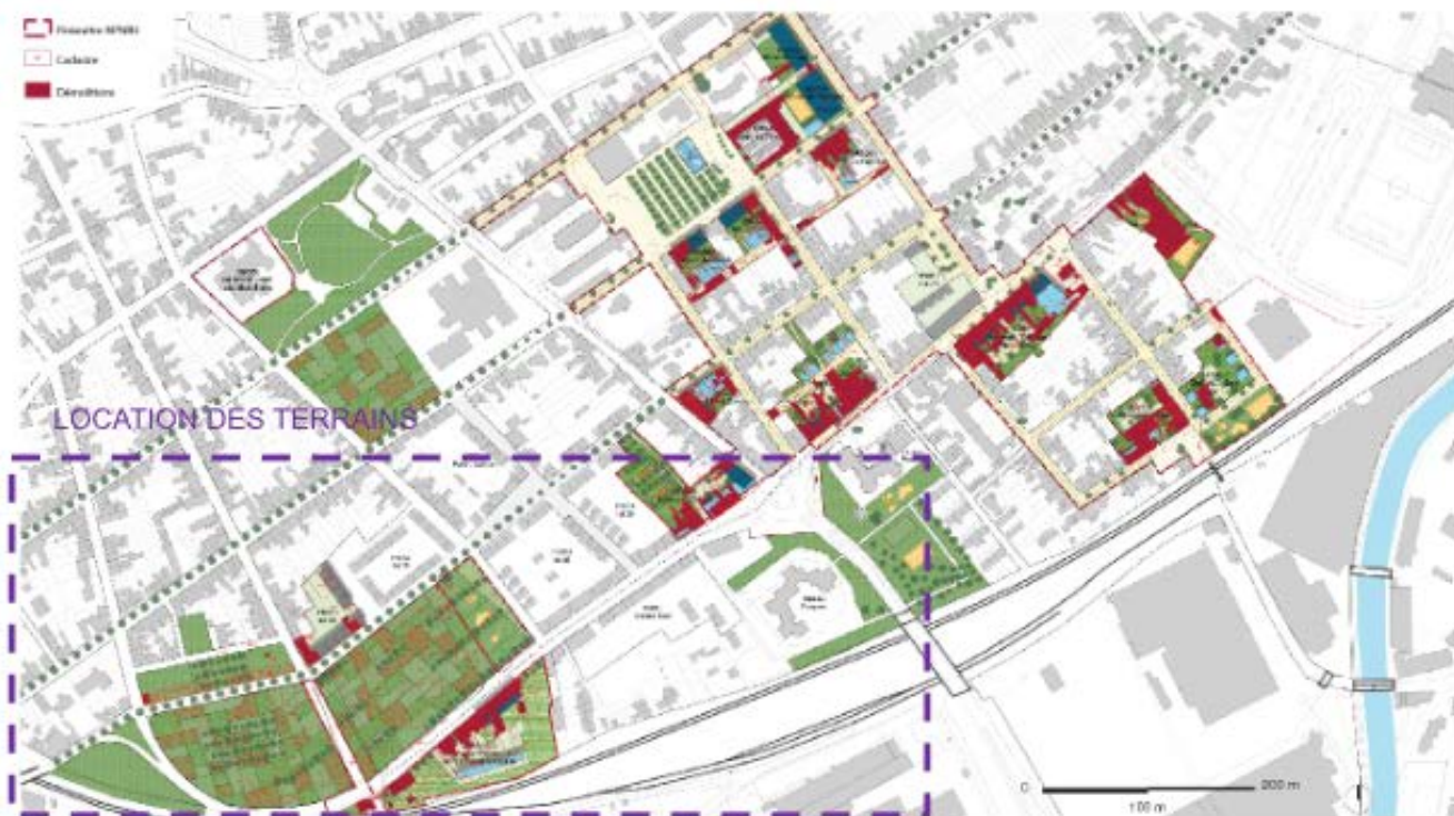
Interfaces avec le NPNRU du quartier de Pont-de-Pierre

En termes d'invariants, le projet agricole devra intégrer, la mise à disposition après déclassement du domaine public d'une partie de la rue des Boulonnerie reliant. Cette rue scinde actuellement les terrains dit des Parisiens Ouest / Est. Les deux autres parcelles mise à disposition sont bordées au sud par les voie ferrées et au nord par la rue d'Hautmont